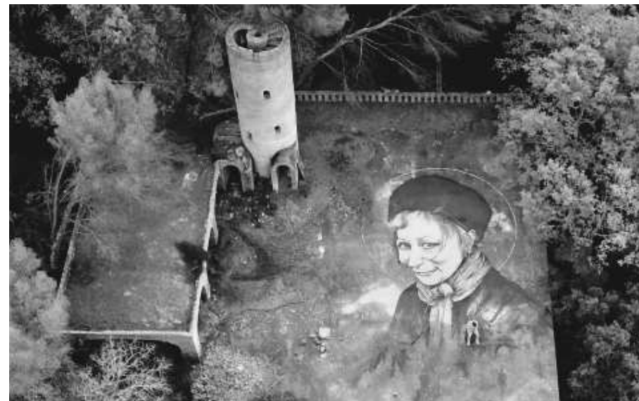
« Ephéméride »