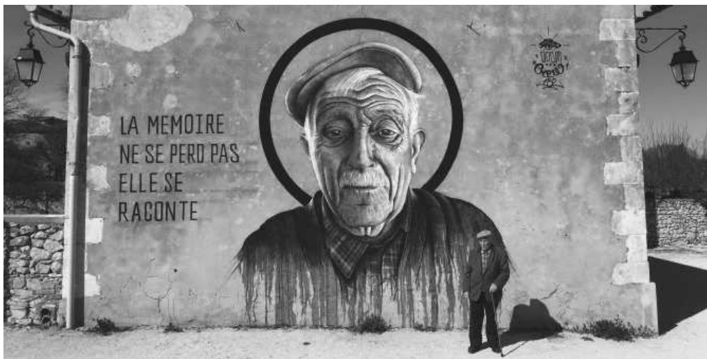
« La mémoire ne se perd pas, elle se raconte » Mars 2018 / Lussan