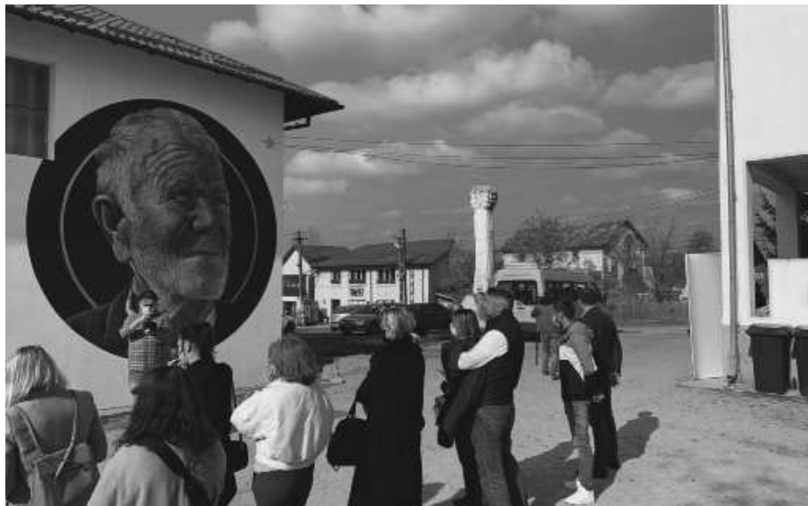
« Petre »