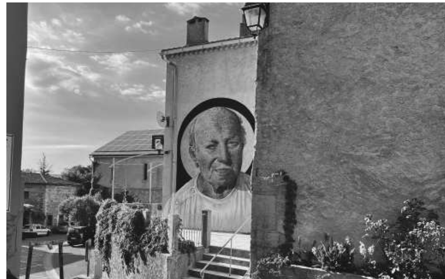
« Claude »

Octobre 2022 / Station Opéra avec la RATP