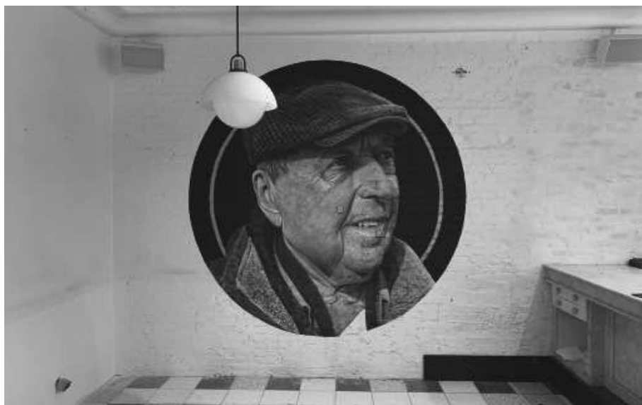
« Charly »

Juillet 2022 / Festival Arts de rue de Mazaugues