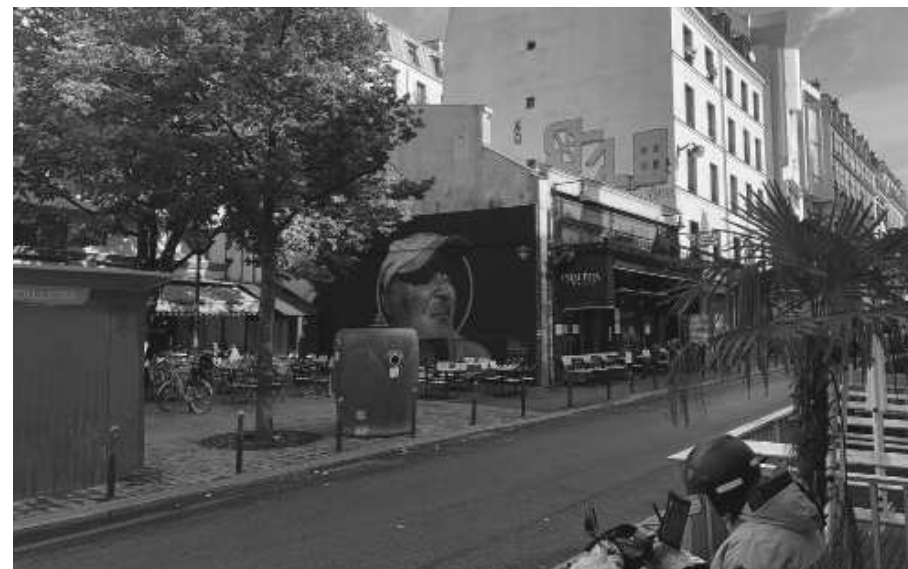
« Laurent »

Octobre 2021 / Le MUR d'Oberkampf, Paris