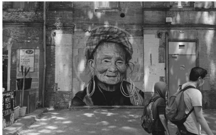
« Souvenir du Nord Vietnam »

Septembre 2020 / Paris 18ème arrondissement