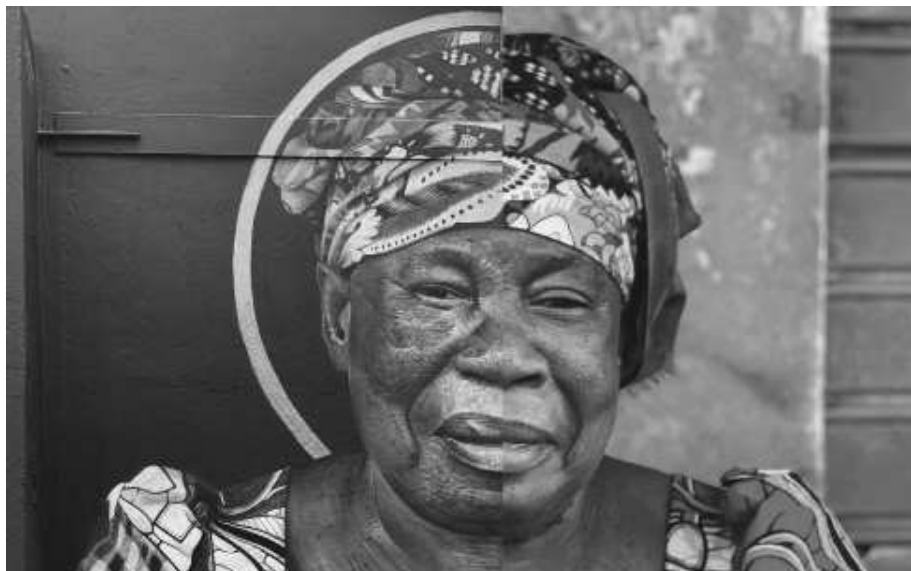
« Mama »

Septembre 2020 / Paris 18ème arrondissement