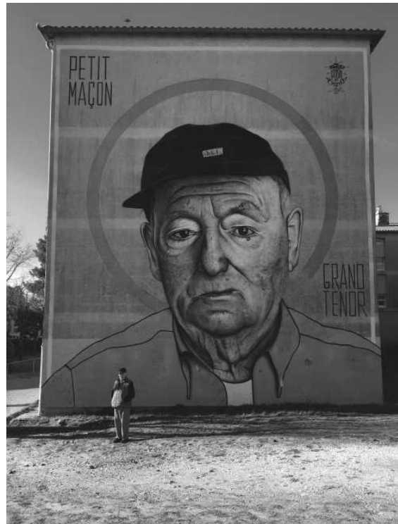
« Petit maçon, grand tenor » Mars 2018 / Uzès