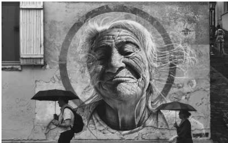
« La bonne aventure »