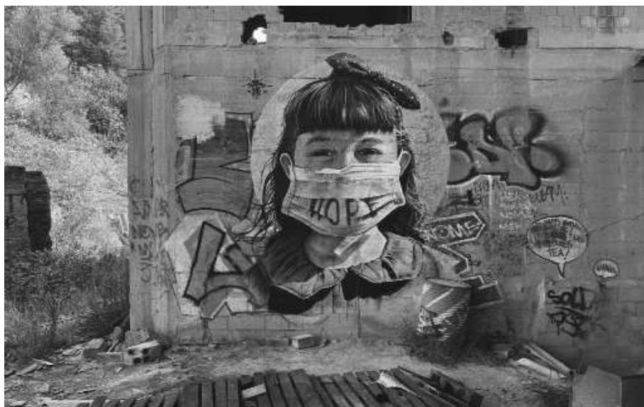
« Enfant du destin »