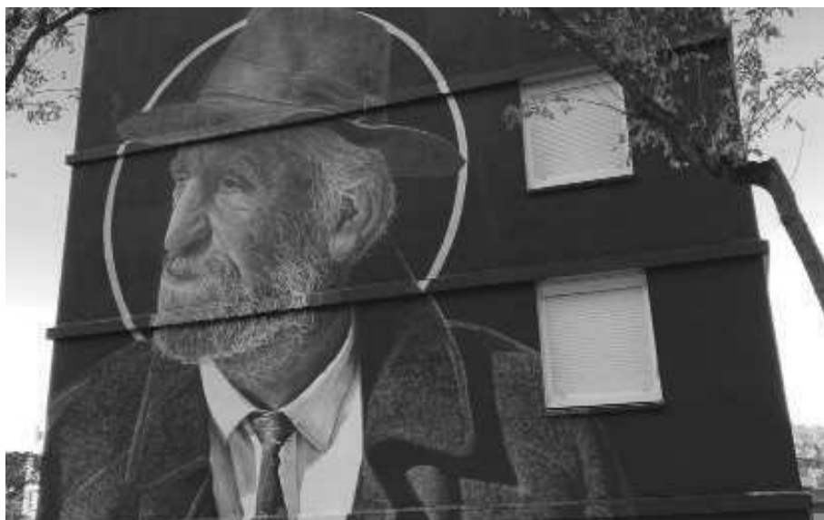
« Abraham »

Octobre 2021 / Le MUR d'Oberkampf, Paris