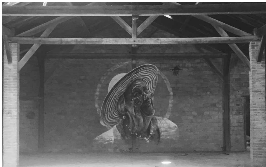
« Beauté intemporelle »

Juin 2018 / Festival Loures Arte Publica à Lisbonne