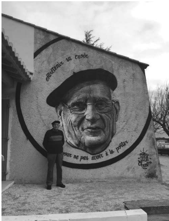
« Entretenir sa croix pour ne pas avoir à la porter » Mars 2018 / Baron